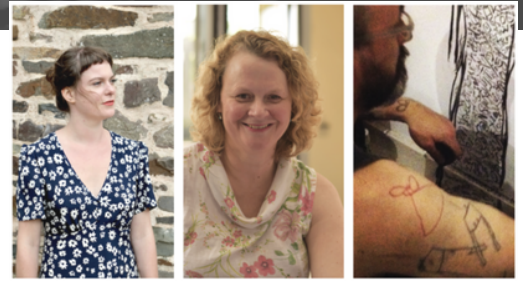
Poets involved in Lake of Eyes Online Poetry Reading