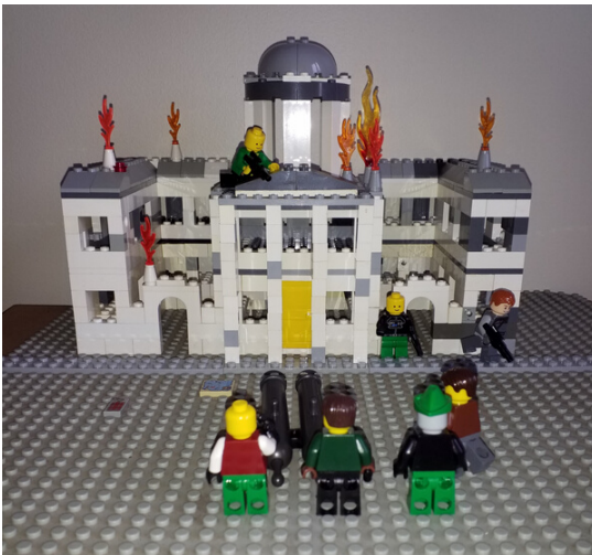
'Na Ceithre Cúirteanna trí thine le linn Chogadh na gCarad', a rinne Alarnagh Barrett McGinley

Thig le grúpaí staire & múinteoirí bheith páirteach sa togra seo go fóill, déan teagmháil le: abarrettmcginley@donegalcoco.ie