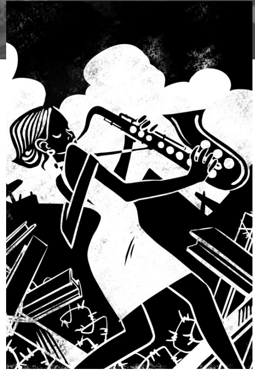
Zandra Queen of Jazz